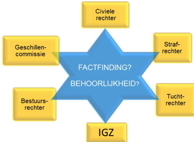
Figuur 2: klachtmogelijkheden

Ik spreek echter mijn zorgen uit over de effectiviteit van het systeem. Al deze mogelijkheden die de patiënt heeft om misstanden in de zorg aan de orde te stellen, zien op telkens een ander aspect van het recht op (zorg voor de) gezondheid (zie figuur 2). Is met de komst van de geschillencommissie het systeem vanuit het oogpunt van patiënten sluitend? Bij het beantwoorden van deze vraag besteed ik bijzondere aandacht aan de ongelijke rol en positie van patiënten aan de ene kant en zorgaanbieders aan de andere kant.